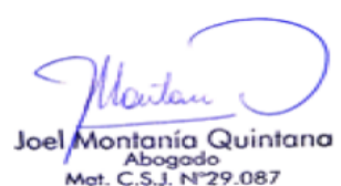
Extraído del escrito de intervención.