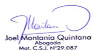
Extraído de un escrito de urgimiento